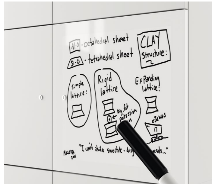
Whiteboard mit Whiteboard-Marker