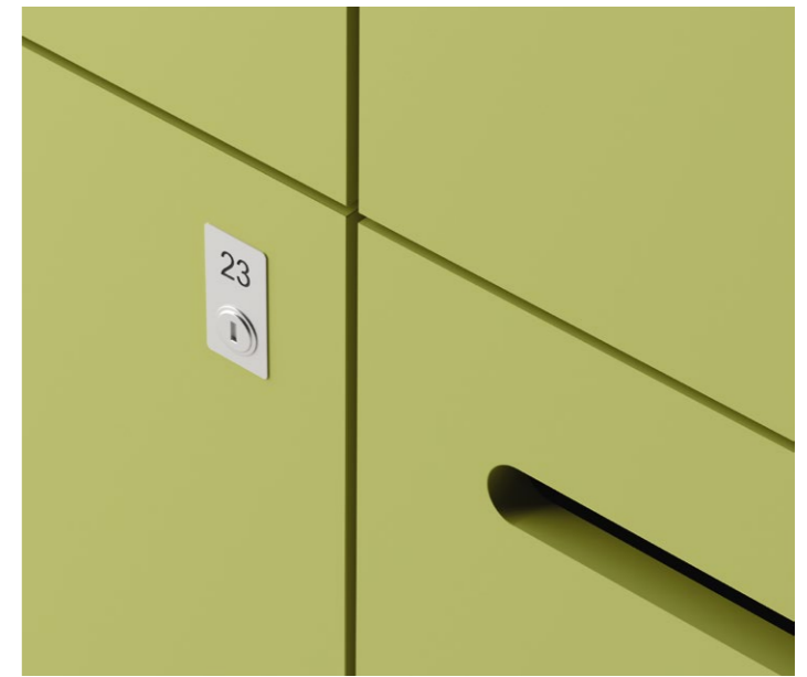
Lehmann-Riegelschliessung mit Kippschlüssel