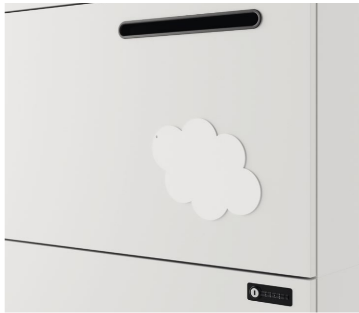
Beschriftbare Magnetbilder als Freiform (Bsp. Wolke)