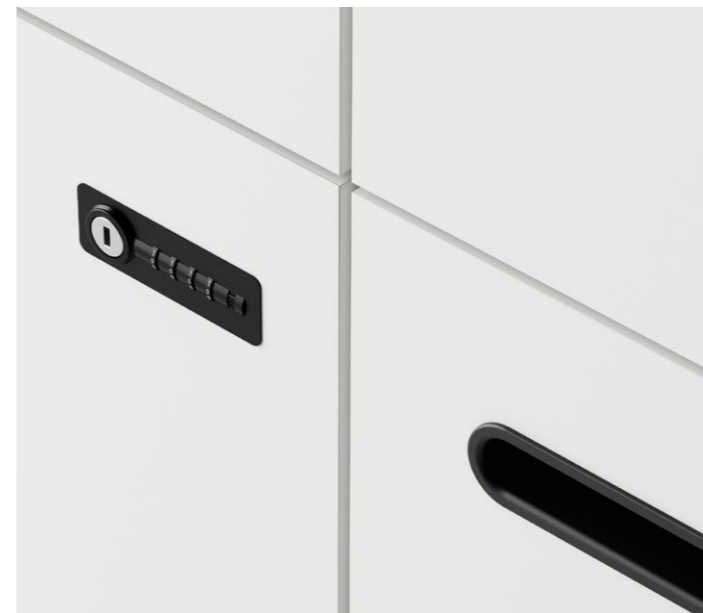
Lehmann-Zahlenschloss mit Wischmechanik