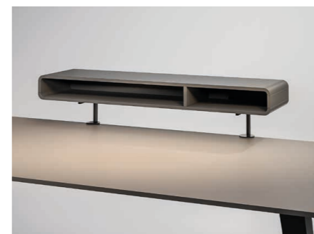
Tischaufsatz offen oder mit Schublade