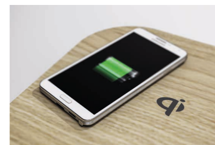
Qi-Charger: kabelloses Aufladen für Qi-fähige Geräte