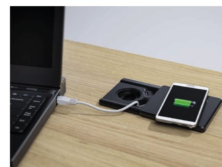
Kabeldurchführung mit Steckdose, USB-Charger und Netzwerkanschluss, optional mit Qi-Charger

Mit cosy'line bringt Ergodata filigranes Design ins Büro: sanft gerundete Formen, optisch leichte Fronten und optional mit formschönen Füßen. So wirken die Möbel leicht und lassen den Bodenplatz frei. Eine harmonisch abgestimmte Material- und Farbpalette bringt Wohlbefinden und Charme ins Büro – typisch cosy.