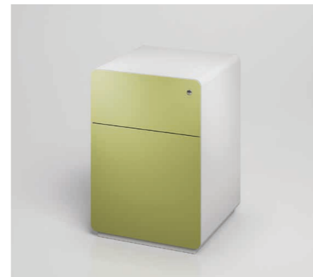
Runde Formen und verjüngte Fronten verleihen cosy'line einen eigenständigen und modernen Charakter